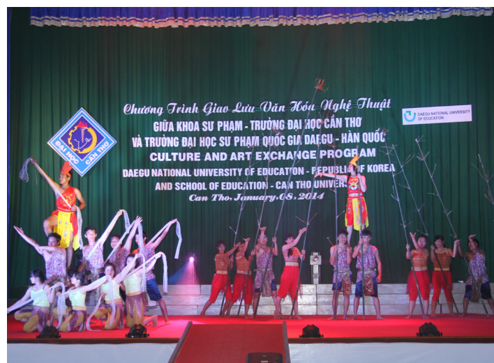
Một tiết mục văn nghệ giao lưu của sinh viên Khoa Sư phạm, Trường ĐHCT

Quốc được thực hiện từ năm 2012. Sự hợp tác đã giúp hai trường có cơ hội hiểu biết sâu sắc và có cái nhìn đầy đủ, ý nghĩa hơn về những giá trị văn hóa, lịch sử và một phần vốn quý báu về nghệ thuật dân tộc của hai quốc gia. Bên cạnh đó là việc nhìn nhận và hoàn thiện hơn về cách tiếp cận giáo dục văn hóa, lịch sử cho sinh viên thông qua chương trình đào tạo. Trong tương lai, hai bên sẽ tiếp tục phát huy và thắt chặt hơn nữa mối quan hệ tốt đẹp này.