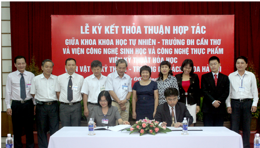
Lãnh đạo Khoa Khoa học Tự nhiên và các Viện thuộc Trường Đại học Bách Khoa Hà Nội ký kết thỏa thuận hợp tác

Ngày 06/12/2013, Lễ ký kết thỏa thuận hợp tác giữa Khoa Khoa học tự nhiên-Trường Đại học Cần Thơ (ĐHCT) với các Viện: Công nghệ Sinh học và Công nghệ Thực phẩm, Kỹ thuật Hóa học, và Vật lý Kỹ thuật thuộc Trường Đại học Bách Khoa Hà Nội đã được tổ chức tại Trường ĐHTC. Tham dự Lễ ký kết có đại diện lãnh đạo các Viện; Vụ Khoa học Công nghệ và Môi trường, Bộ Giáo dục và Đào tạo. Về phía Trường ĐHTC có đại diện Ban Giám hiệu, các đơn vị liên quan cùng lãnh đạo và cán bộ giảng dạy của Khoa.