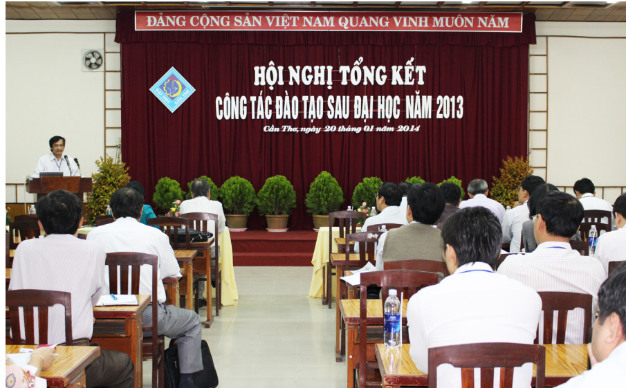
Toàn cảnh Hội nghị Tổng kết công tác đào tạo sau đại học năm 2013