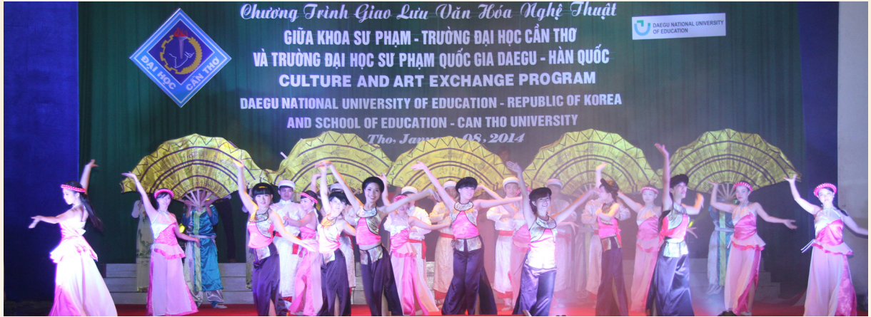
Tiết mục múa của Trường ĐHCT trong chương trình giao lưu

T rong khuôn khổ hợp tác giữa hai bên, từ ngày 05 đến ngày 09/01/2014, Trường Đại học Sư phạm Quốc gia Daegu-Hàn Quốc đã có chuyến thăm và làm việc với Khoa Sư phạm-Trường Đại học Cần Thơ (ĐHCT) nhằm trao đổi, giao lưu văn hóa-văn nghệ và tìm hiểu cách thức giáo dục văn hóa cho sinh viên. Tối ngày 08/01/2014, tại Hội trường Lớn, Trường ĐHCT đã diễn ra chương trình giao lưu văn hóa-văn nghệ với chủ đề: “Người phụ nữ Việt Nam trong công cuộc dựng nước và giữ nước”.