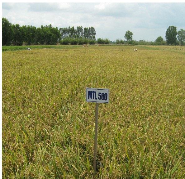
Giống lúa MTL480

Hình thức chuyển giao: Chuyển giao công nghệ và hợp tác sản xuất.