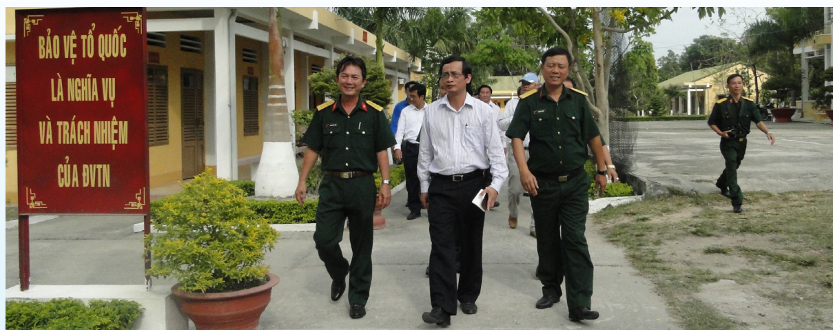
Đoàn công tác Trường ĐHCT tham quan cơ sở vật chất của Sư đoàn 330

Kết thúc chuyến thăm, chúc tết chiến sĩ Sư đoàn 330, đọng lại trong mỗi cán bộ và sinh viên Trường ĐHCT là những niềm vui và cảm xúc khó tả khi nghĩ về các anh chiến sĩ đang ngày đêm bảo vệ chủ quyền và toàn vẹn lãnh thổ của tổ quốc. Để hoàn thành nhiệm vụ các anh sẵn sàng hi sinh niềm hạnh phúc cá nhân mang đến cuộc sống yên vui cho nhân dân. Vì vậy, những người dân hậu phương luôn hướng về các anh những người lính canh giữ đất trời.