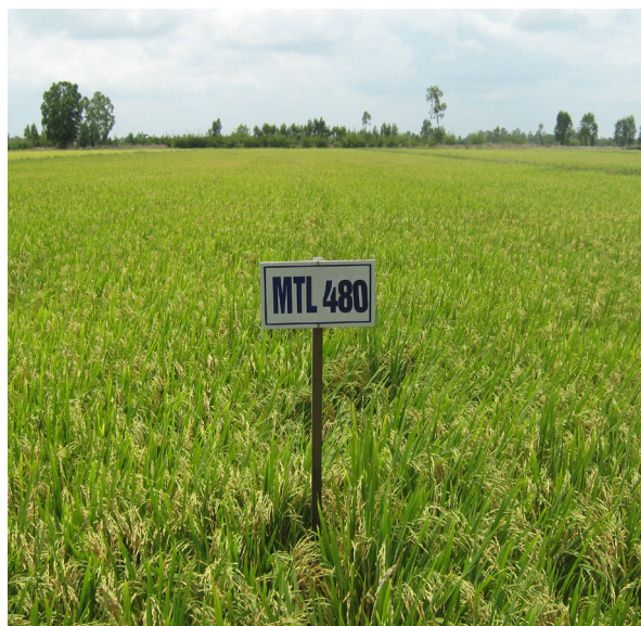
Giống lúa MTL560

B ộ môn Tài nguyên Cây trồng, Viện Nghiên cứu phát triển Đồng bằng Sông Cửu Long, Trường Đại học Cần Thơ đã nghiên cứu chọn tạo thành công giống lúa MTL 560 và giống MTL 480, đã trồng thử nghiệm và tổ chức Hội thảo đánh giá vụ Đông Xuân 2011-2012 tại khu Hòa An (Trường Đại học Cần Thơ) thuộc xã Hòa An, huyện Phụng Hiệp, tỉnh Hậu Giang.