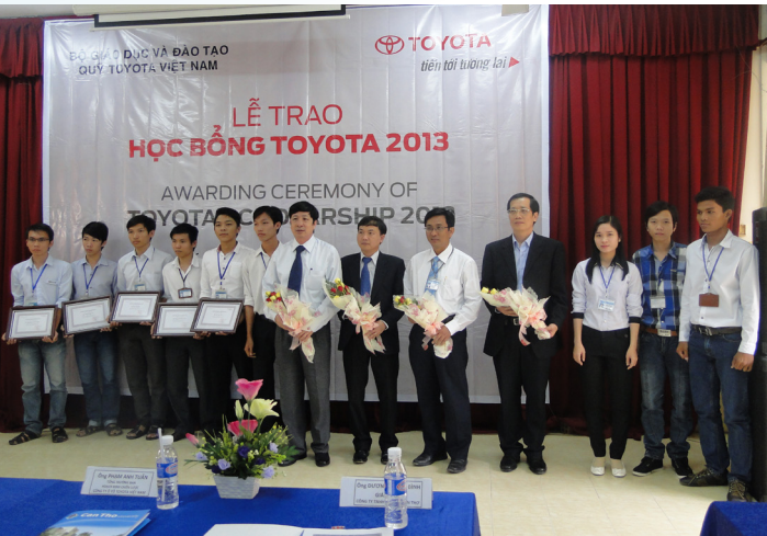
Sinh viên nhận học bổng tặng hoa cho các đại biểu