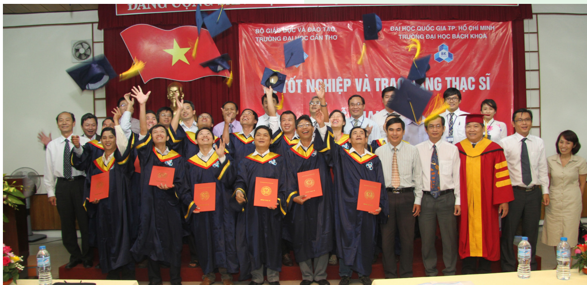
Các tân khoa vui mừng với tấm bằng tốt nghiệp trong tay

Ngày 03/01/2014, tại Hội trường II, Trường Đại học Cần Thơ (ĐHCT) đã phối hợp với Trường Đại học Bách Khoa Thành phố Hồ Chí Minh tổ chức Lễ Tốt nghiệp và Trao bằng Thạc sĩ-Lễ Khai giảng khóa đào tạo Thạc sĩ tại Cần Thơ năm 2013. Tham dự buổi Lễ, có đại diện lãnh đạo của Trường Đại học Bách Khoa Thành phố Hồ Chí Minh, đại diện lãnh đạo Trường ĐHTC và 27 tân Thạc sĩ cùng 68 học viên vừa trúng tuyển khóa đào tạo Thạc sĩ tại Cần Thơ.