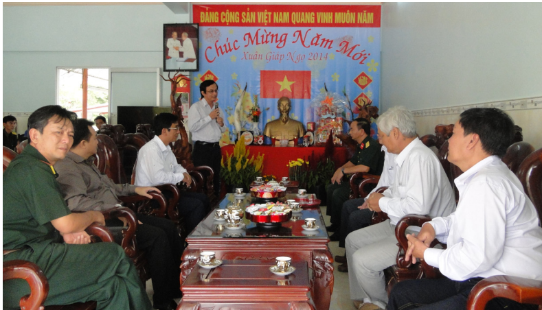
Buổi giao lưu chúc tết giữa Trường ĐHCT và Sư đoàn 330

Những cánh mai, đào đã nở rộ trên khắp mọi miền đất nước, mọi người đang nô nức đón chào những ngày xuân nồng ấm bên gia đình, người thân và bạn bè. Thế nhưng, ở nơi biên cương xa xôi của tổ quốc các anh chiến sĩ Sư đoàn 330 đang làm nhiệm vụ thiêng liêng và lặng lẽ hướng về quê nhà bằng cả trái tim son sắt và kiên trung.