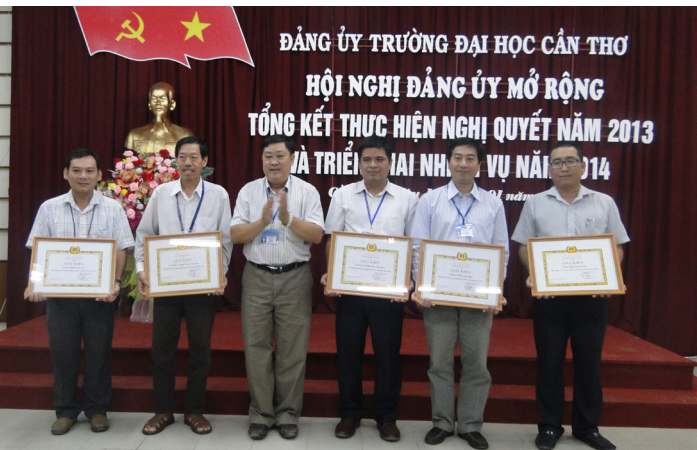
Đại diện 05 tập thể nhận giấy khen do có thành tích trong phong trào thi đua dân vận khéo trong năm 2013